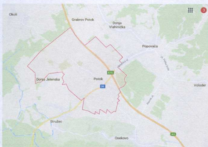
mjesto Potok na cesti Sisak-Popovača